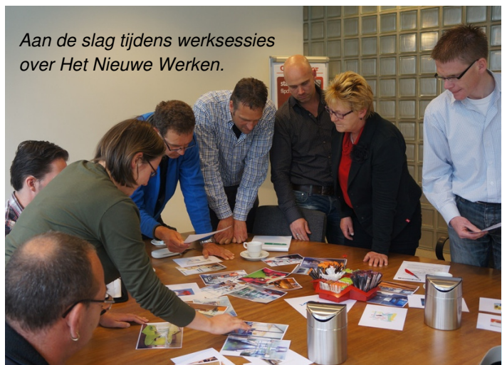
Aan de slag tijdens werksessies over Het Nieuwe Werken.

Nadat de gespreksnotitie werd vastgesteld, hebben er verschillende werksessies plaatsgevonden met als doel om deze principes te verkennen en nader uit te werken. Het onderwerp leeft bij de toekomstige medewerkers, want in totaal hebben zo'n zeventig medewerkers aan de speciale sessies deelgenomen. De gespreksnotitie is daarop