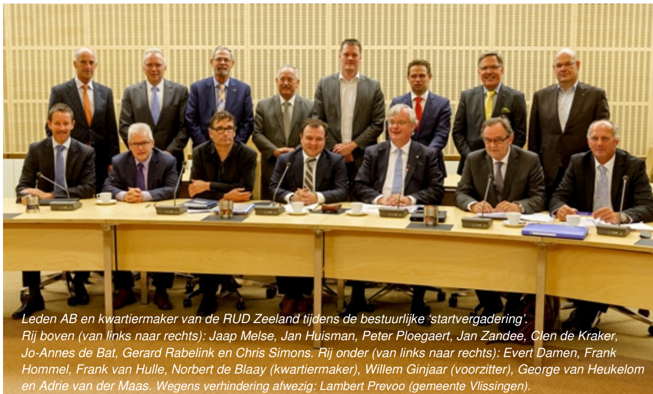
Leden AB en kwartiermaker van de RUD Zeeland tijdens de bestuurlijke 'startvergadering'.