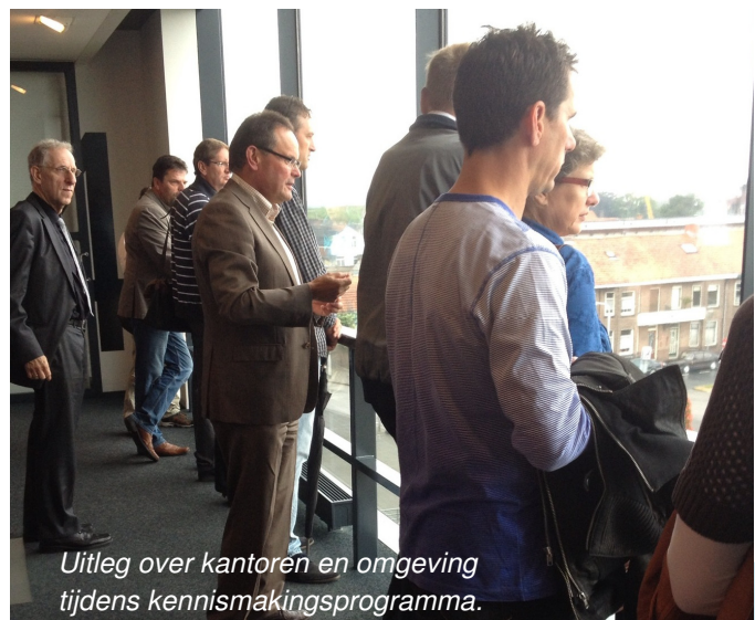
Uitleg over kantoren en omgeving tijdens kennismakingsprogramma.

Na de ontvangst volgde een verkenning van de gemeentelijke kantoren en wandelingen door de binnenstad van Terneuzen. De rondleidingen werden begeleid door medewerkers van de